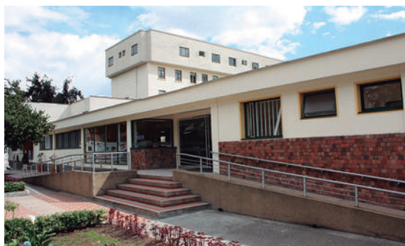
• Entrada principal del Hospital

En la Fundación Universitaria de Ciencias de la Salud (FUCS) se definió como objetivo prioritario contar con un segundo hospital para asegurar lugares idóneos para la práctica de sus estudiantes, con la infraestructura, dotación y recurso humano suficientes para los procesos educativos. Dentro del análisis del entorno se encontró la opción de adquirir una entidad y rehabilitarla, lo que permitiría acelerar su puesta en marcha, en comparación con la compra de un terreno y la construcción de un nuevo hospital. En el mes de julio del año 2005 se realizaron los primeros acercamientos del Presidente del Consejo Superior de la FUCS con el ente liquidador de la Fundación Hospital Infantil Lorencita Villegas de Santos para la negociación de la compra de los predios del antiguo Hospital, la cual culminó en diciembre de ese mismo año (2005) con la firma de la escritura pública correspondiente.